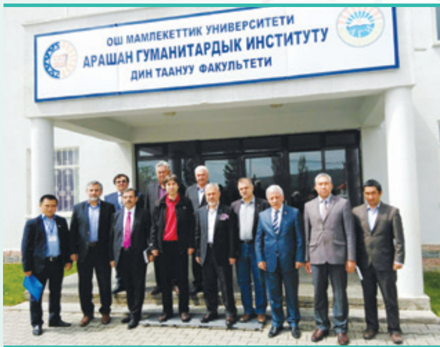
Araşan İlahiyet Fakültesini ziyaret